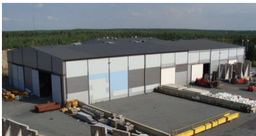
Volttitie 18, Rauma