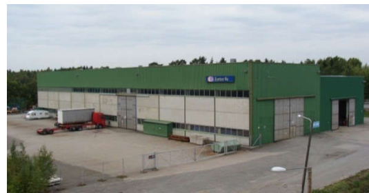
Latomäentie 2, Rauma